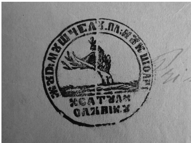
Ștampila satului Slănic, folosită înainte de anul 1860, având următorul conținut, scris cu alfabet chirilic: „Jud<ețul> Mușcelu. Pl<aiul> Nucșoari. Satul Slănicu“