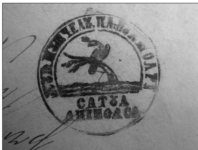
Ștampila satului Aninoasa, folosită înainte de anul 1860, având următorul conținut, scris cu alfabet chirilic: „Jud<ețul> Mușcelu. Pl<aiul> Nușoari. Satul Aninoasa“