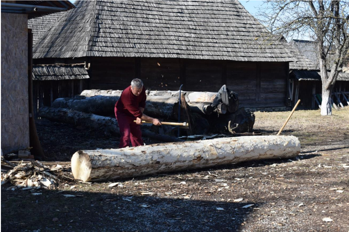
Pregătirea materialului lemnos