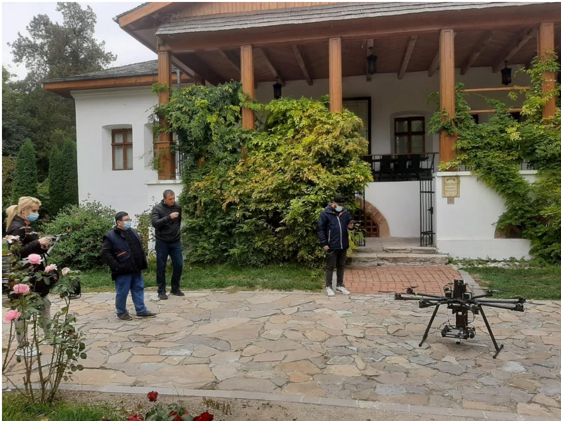
Scanări construcții și teren, cu drona