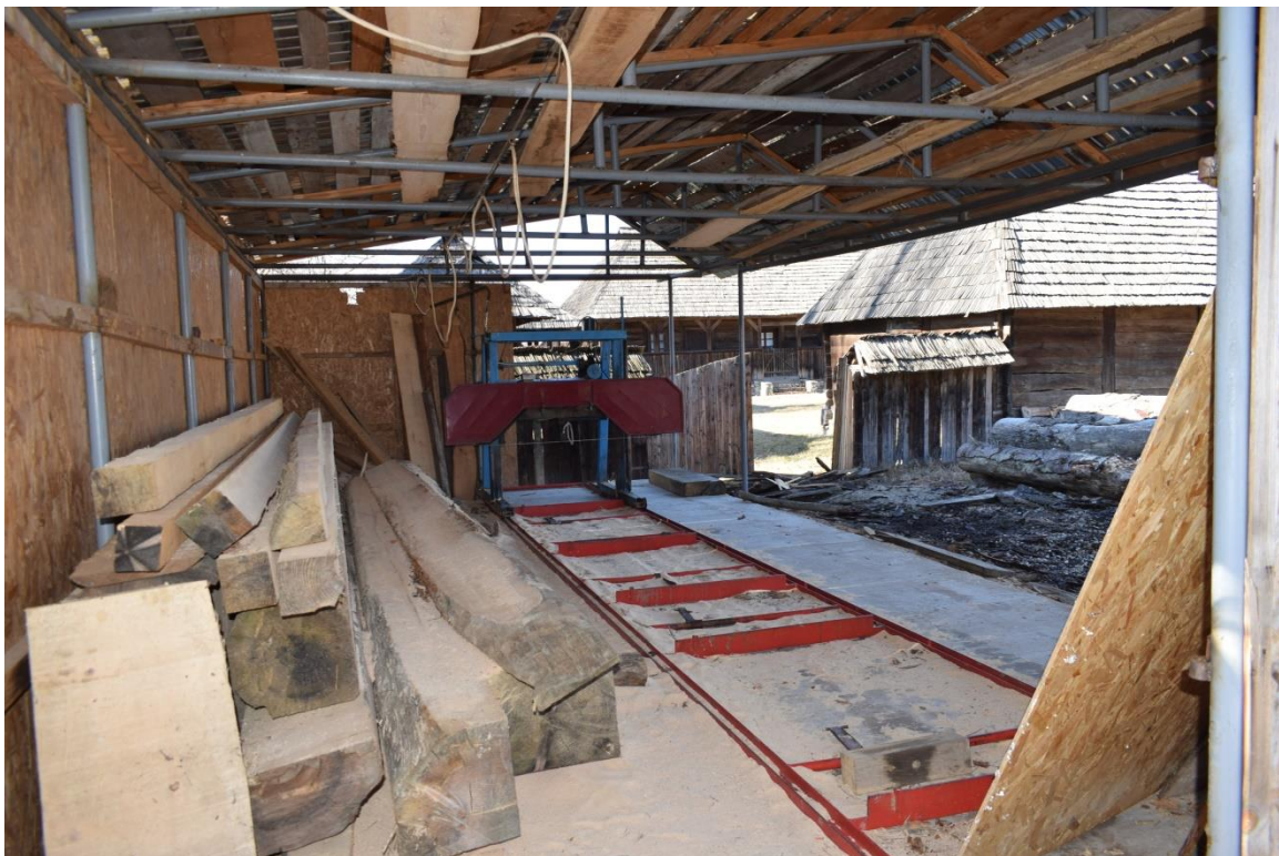
Debitarea materialului lemnos pentru diverse lucrări