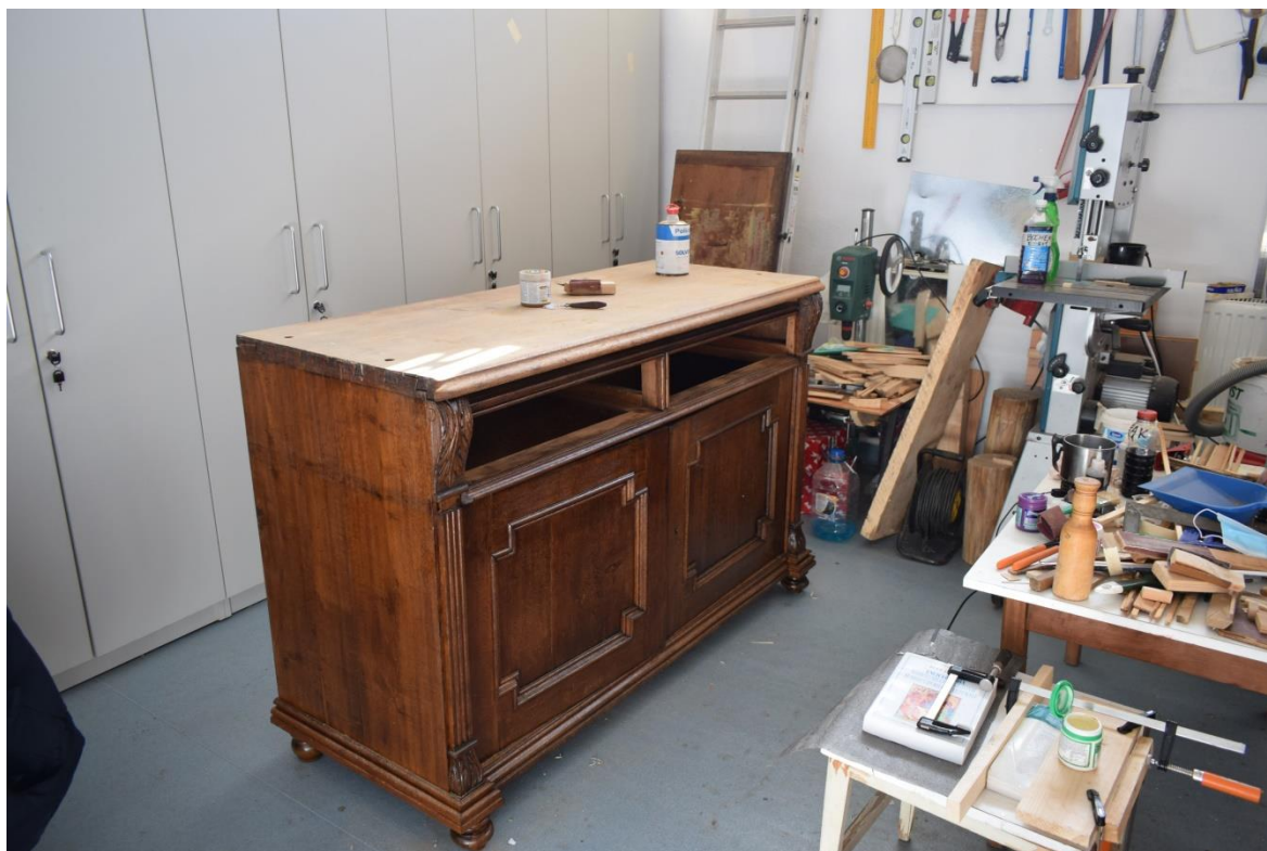
Restaurare obiecte din lemn