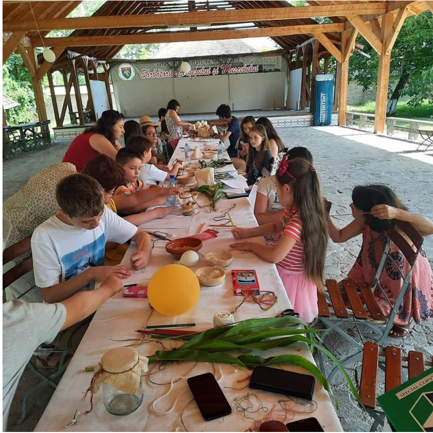
Tabără Sporul casei