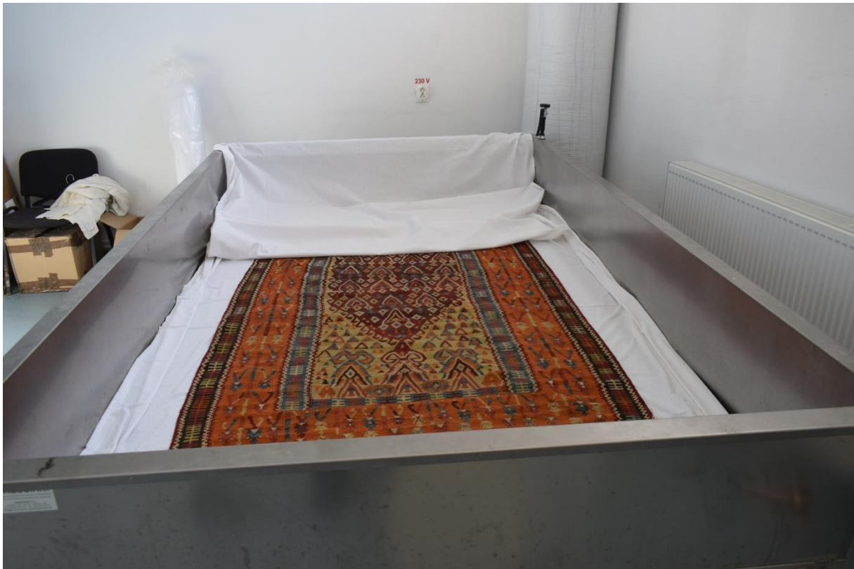
Cuvă pentru tratarea textilelor