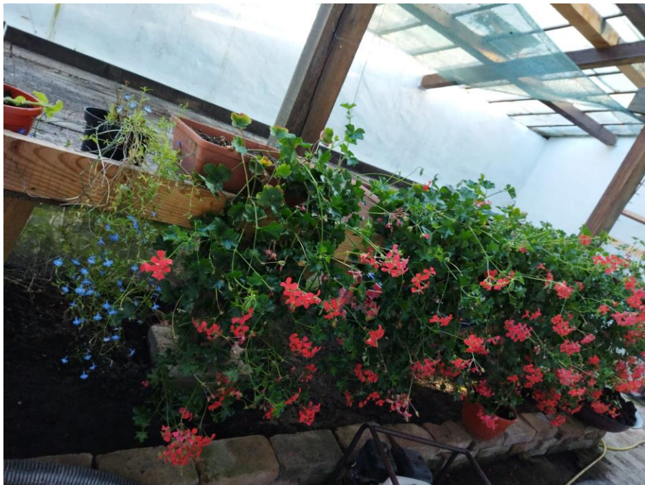
Flori în sera Goleștilor