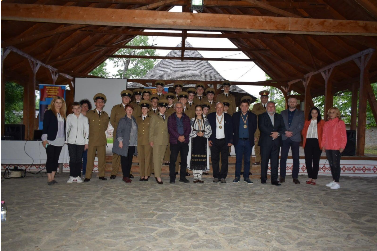
Manifestare dedicată Revoluției de la 1821, în colaborare cu D.J. Gorj și D.J. Argeș