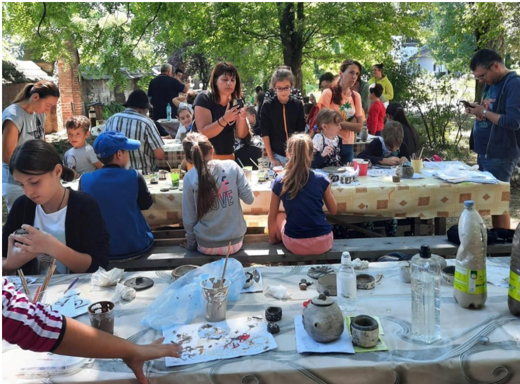
Tabără de ceramică