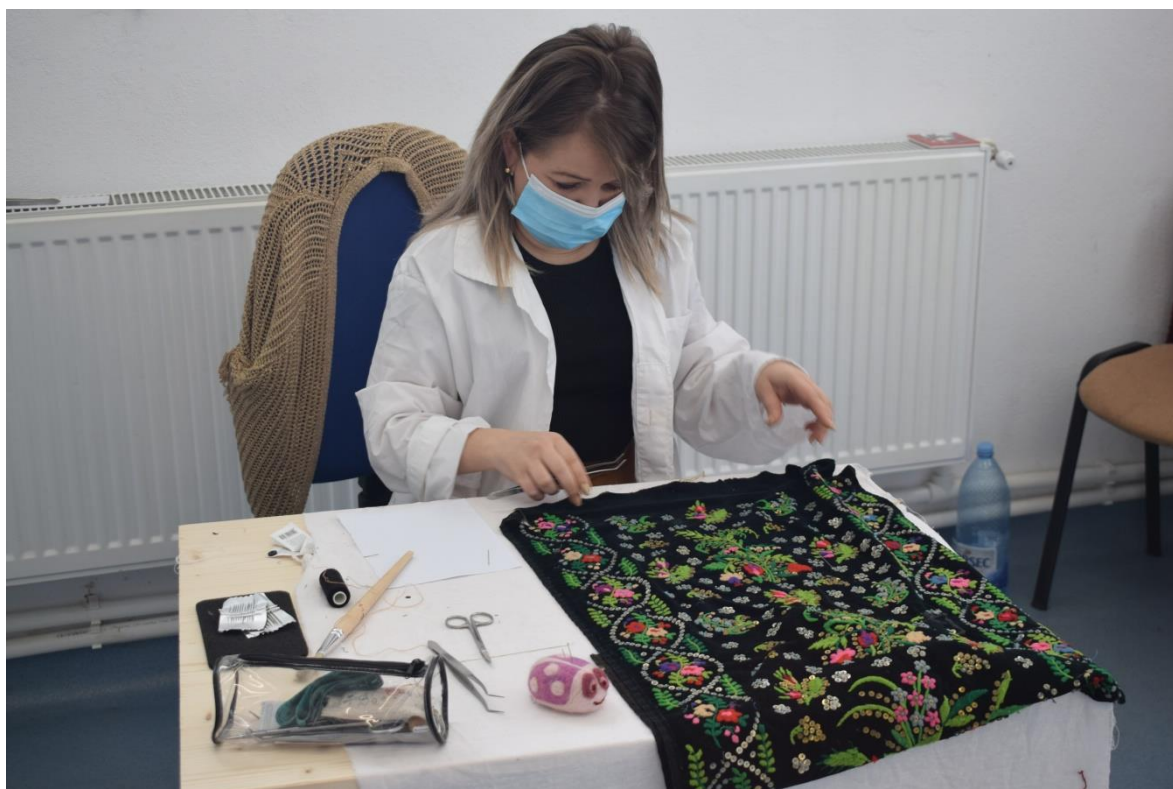
Restaurare obiecte textile