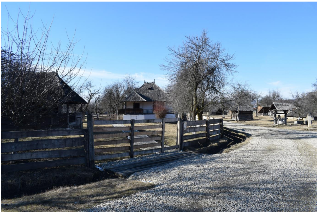
Reparații garduri, podețe