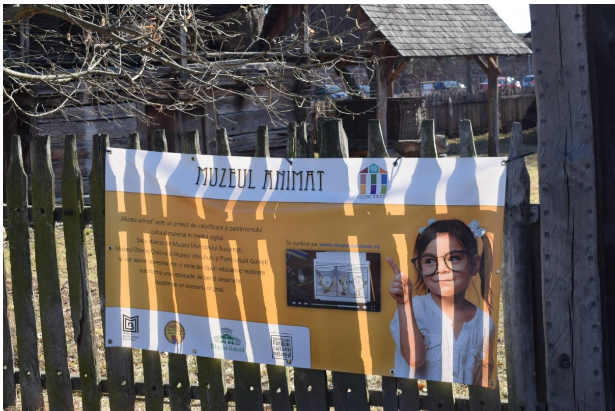
Afiș proiect Muzeul Animat