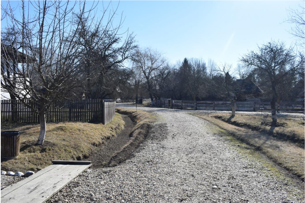
Întreținere șanțuri pluviale