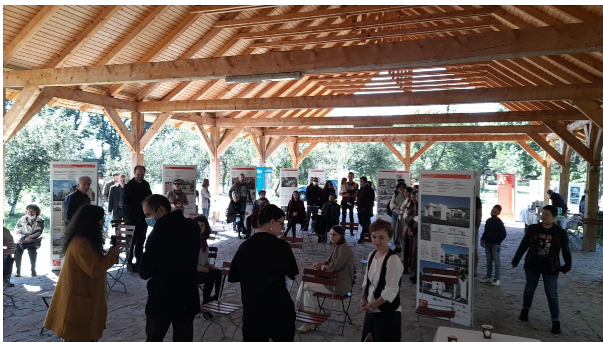
Anuala de Arhitectură Muntenia-Oltenia