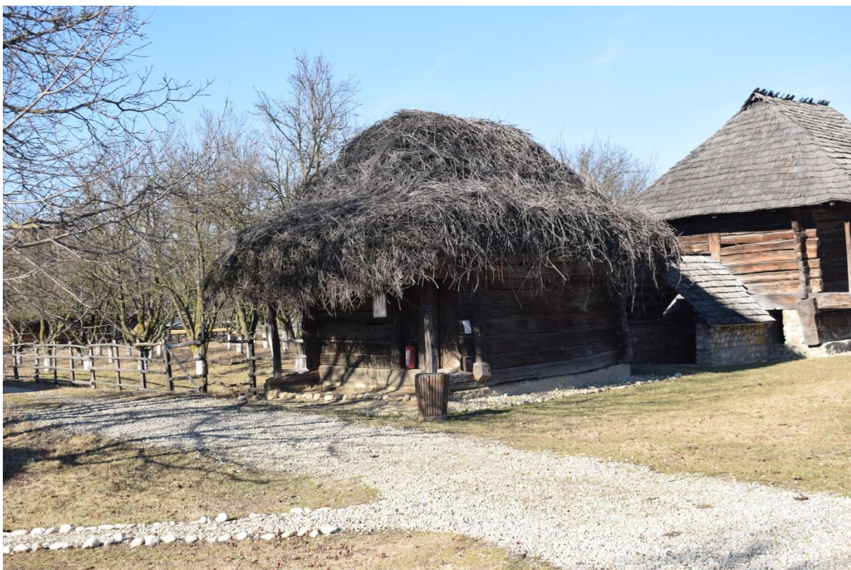
Reparații acoperișuri din joarde de viță-de-vie