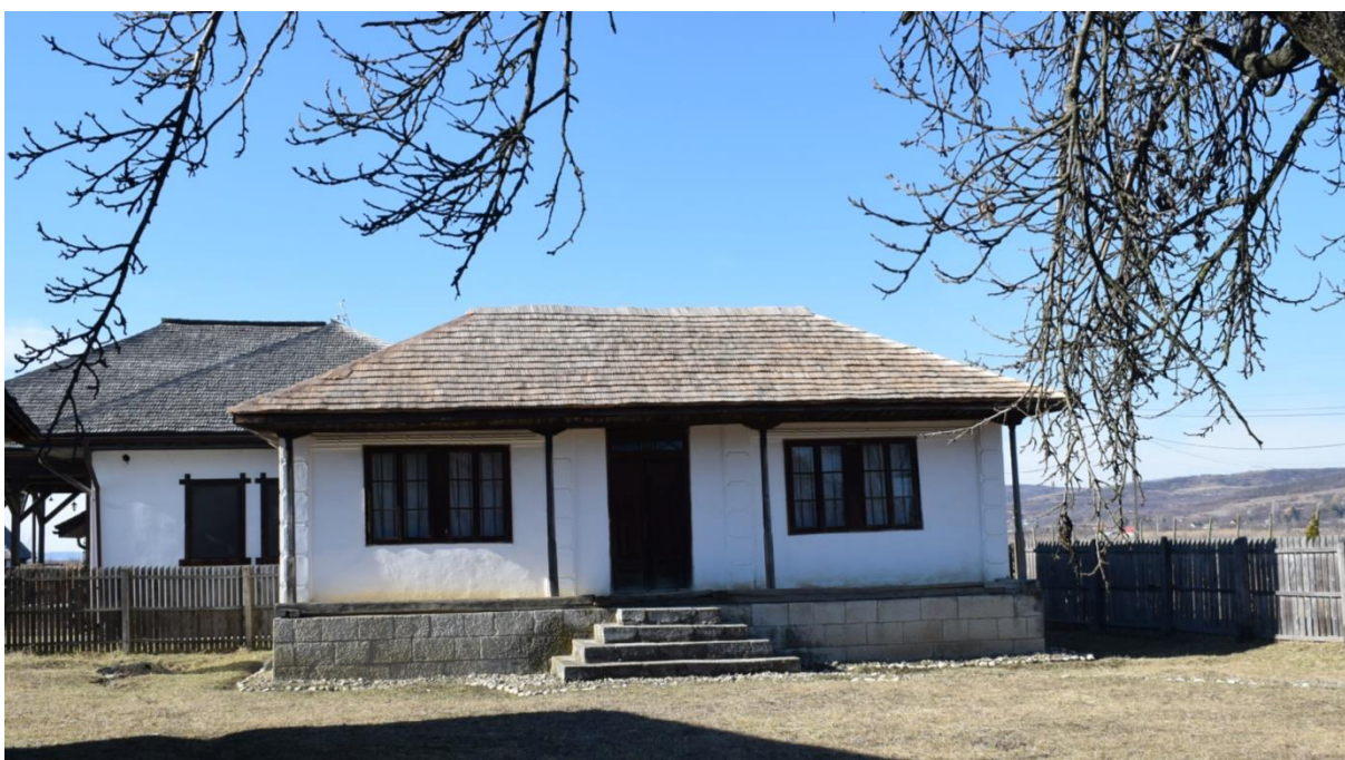
Reparații acoperișuri din șită